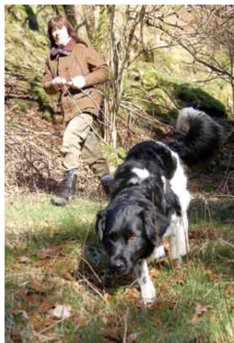
Stabyhoun er kjent for å være dyktige og spornøye ettersøkhunder.

Rasen stammer fra det friesiske skogsområdet i Nederland. Det ble forsøkt å danne en god jakt- og vakthund ved å blande stabyhoun med områdetets wetterhoun, med det resultat at begge rasene var i ferd å forsvinne. Rasen